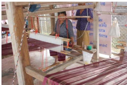
ภาพที่ 2 การลงพื้นที่เก็บข้อมูล

ในขั้นตอนนี้ผู้วิจัยได้ดำเนินการเพื่อศึกษาและเก็บรวบรวมข้อมูลภูมิปัญญาท้องถิ่นด้านการทอผ้าไหมพื้นเมืองของจังหวัดอุบลราชธานี ในเขตอำเภอเมืองอุบลราชธานี โดยผู้วิจัยได้กำหนดกรอบของการเก็บข้อมูลออกเป็น 4 ด้าน ได้แก่ ข้อมูลด้านวัสดุ ข้อมูลด้านกระบวนการผลิต ข้อมูลด้านแหล่งผลิต ข้อมูลด้านลวดลายผ้าไหมของจังหวัดอุบลราชธานี โดยมี การทบทวนวรรณกรรมที่เกี่ยวข้องกับเก็บรวบรวมข้อมูลภูมิปัญญาท้องถิ่นด้านการทอผ้าไหมพื้นเมืองของจังหวัดอุบลราชธานี เพื่อรวบรวมข้อมูลที่ได้จากการทบทวนวรรณกรรมมากำหนดหัวข้อในการสัมภาษณ์ช่างทอผ้าพื้นเมือง โดยจัดเก็บข้อมูลเกี่ยวกับ ชื่อลายผ้าไหม ข้อมูลวิธีการทอผ้าไหมลายพื้นเมือง รายละเอียดของผ้าไหมที่เป็นลายพื้นเมืองของจังหวัดอุบลราชธานี โดยได้รวบรวมข้อมูลจากเอกสารต่างๆ ทั้งจากหนังสือประวัติบ้านหนองบ่อ ที่มีข้อมูลเกี่ยวกับการแต่งกายที่มีความเป็นเอกลักษณ์ และมีผ้าทอพื้นเมืองที่มีประวัติอันยาวนาน และจากการวิจัยผ้าทอพื้นเมืองอีสานใต้ ของประทับใจ สึกขา ที่ได้ทำการศึกษาและรวบรวมข้อมูลผ้าทอพื้นเมืองในด้านกระบวนการผลิตเส้นใย กรรมวิธี/เทคนิคการทอ กระบวนการทำให้เกิดสี ลวดลายผ้า รวมถึงการใช้ผ้า ที่เป็นภูมิปัญญาท้องถิ่นอีสานใต้ เพื่อนำมาจัดสร้างเป็นฐานข้อมูล ซึ่งเป็นองค์ความรู้พื้นฐานที่จำเป็นต่อการพัฒนาผ้าทอพื้นเมืองอีสานใต้ในด้านต่างๆ พบว่า ชาวอีสานมีการแต่งกายที่เป็นเอกลักษณ์ของตน คือ หญิงมักจะนุ่งผ้าซิ่นที่มีเชิง ส่วนชายมักจะนุ่งกางเกงมีขาครึ่งน่องหรือนุ่งโสร่งผ้าไหม (องค์การบริหารส่วนตำบลหนองบ่อ, 2552) จากนั้นก็รวบรวมข้อมูลที่ได้จากการทบทวนมากำหนดเป็นคำถามที่ใช้ในการสัมภาษณ์