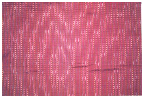
ภาพที่ 3 ผ้ากาบบัว

2.2.4 ข้อมูลลวดลายผ้าไหมพื้นเมืองของจังหวัดอุบลราชธานี มีความงดงามและมีลวดลายที่เป็นเอกลักษณ์เฉพาะของแต่ละท้องถิ่น โดยจะมีลวดลายที่เป็นการสื่อถึงวัฒนธรรมประเพณีในท้องถิ่นนั้นๆ ซึ่งลวดลายผ้าไหมพื้นเมืองที่ชาวตำบลหนองบ่อได้ทำการทอมาเป็นเวลาช้านาน ได้แก่ ผ้ามัดหมี่ลายปราสาทผึ้ง ผ้าลายลูกแก้ว ผ้าพื้นหรือเรียกอีกชื่อว่าผ้าควบ ผ้าโสร่ง ผ้าห่มขิด ผ้าไหมลายลูกแก้วย้อมมะเกลือ ผ้ากาบบัว เป็นต้น