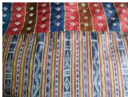
ภาพที่ 4 ผ้ามัดหมี่ลายปราสาทผึ้ง

2.2.5 ข้อมูลด้านช่างทอผ้า ในการศึกษาครั้งนี้ได้ทำการเก็บข้อมูลช่างทอผ้าไหมพื้นเมืองด้วย ซึ่งช่างทอแต่ละท่านมีประสบการณ์ในการทอผ้ามาเป็นเวลานาน โดยมีวิธีการเรียนรู้การทอผ้าจากบรรพบุรุษที่ได้สืบทอดวิธีการทอผ้าต่อๆ กันมา